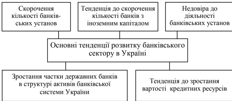
Рисунок 1 – Найбільш вагомі тенденції розвитку банківського сектору України протягом 2013–2017 років

державного регулятора лише тільки підринають довіру до всього банківського сектору України.