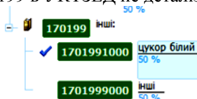
Рисунок 4 – Фрагмент кодової структури УКТЗЕД на рівні товарної підпозиції 170199 та товарної підкатегорії 1701991000 у програмі «MDEplorer»

Товарна під позиція 170199 в УКТЗЕД не деталізована (рис. 4).