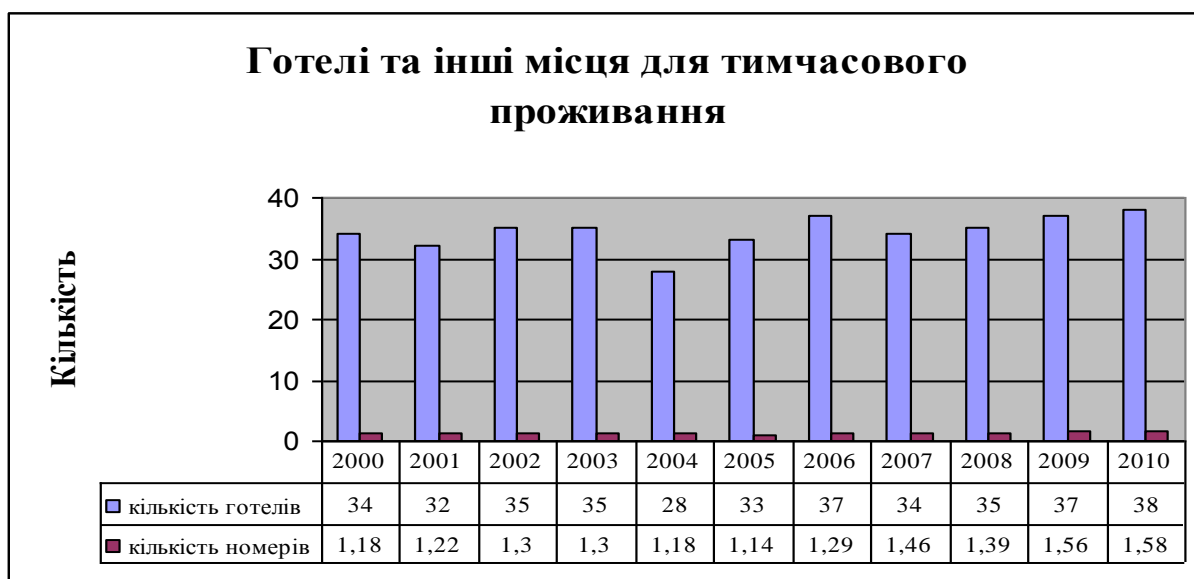
Рис. 1.2.2. Готелі та інші місця тимчасового проживання [64].

марку та залишаються на досить високому рівні, цим самим створюючи конкуренцію іншим закладам розміщення, що є позитивним фактором для розвитку туристичної інфраструктури регіону. За статистичними показниками прослідковуються останні тенденції розвитку інфраструктурного забезпечення в Україні в цілому. Усі підприємства готельного господарства намагаються не тільки розширити свій номерний фонд а в першу чергу його модернізувати. Високий рівень обслуговування та комфорту, для клієнта мають більше значення ніж місткість готелю.