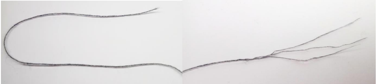
Рис. 2. Зовнішній вигляд пряжі

Згідно з ДСТУ 4057 ідентифікація волокнистого складу передбачає проведення якісного аналізу для однорідного матеріалу [2]. Механічними методами є визначення характеристик горіння та мікроскопічні дослідження. Результати визначення характеристик горіння пряжі бавовняної механічним методом відповідали особливостям для бавовняних волокон. Мікроскопічне дослідження полягало у визначенні природи волокна за допомогою мікроскопа. Вигляд волокон зафіксований за допомогою камери та показаний на рис. 3.