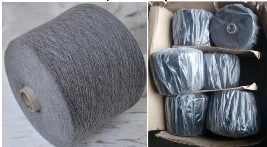
Рис. 1. Зображення пряжі бавовняної гребінної меланжевої для трикотажного виробництва

Забезпечення якості текстильних товарів є одним з найважливіших факторів підвищення рівня життя, соціальної й екологічної безпеки населення. Саме тут виникає актуальне питання про визначення природи волокон у готових виробах. Велика кількість підприємств-імпортерів звертаються за допомогою в експертні організації та лабораторії з метою забезпечення достовірності під час купівлі певного виду волокон і пряжі. Об'єктом дослідження була пряжа бавовняна гребінна меланжева для трикотажного виробництва. Країна походження – Узбекистан. Склад – 100% бавовняні волокна. Маса одного мотка пряжі з бобіною становить 1,4 кг. Об'єкт упакований у поліетиленовий пакет (рис. 1).