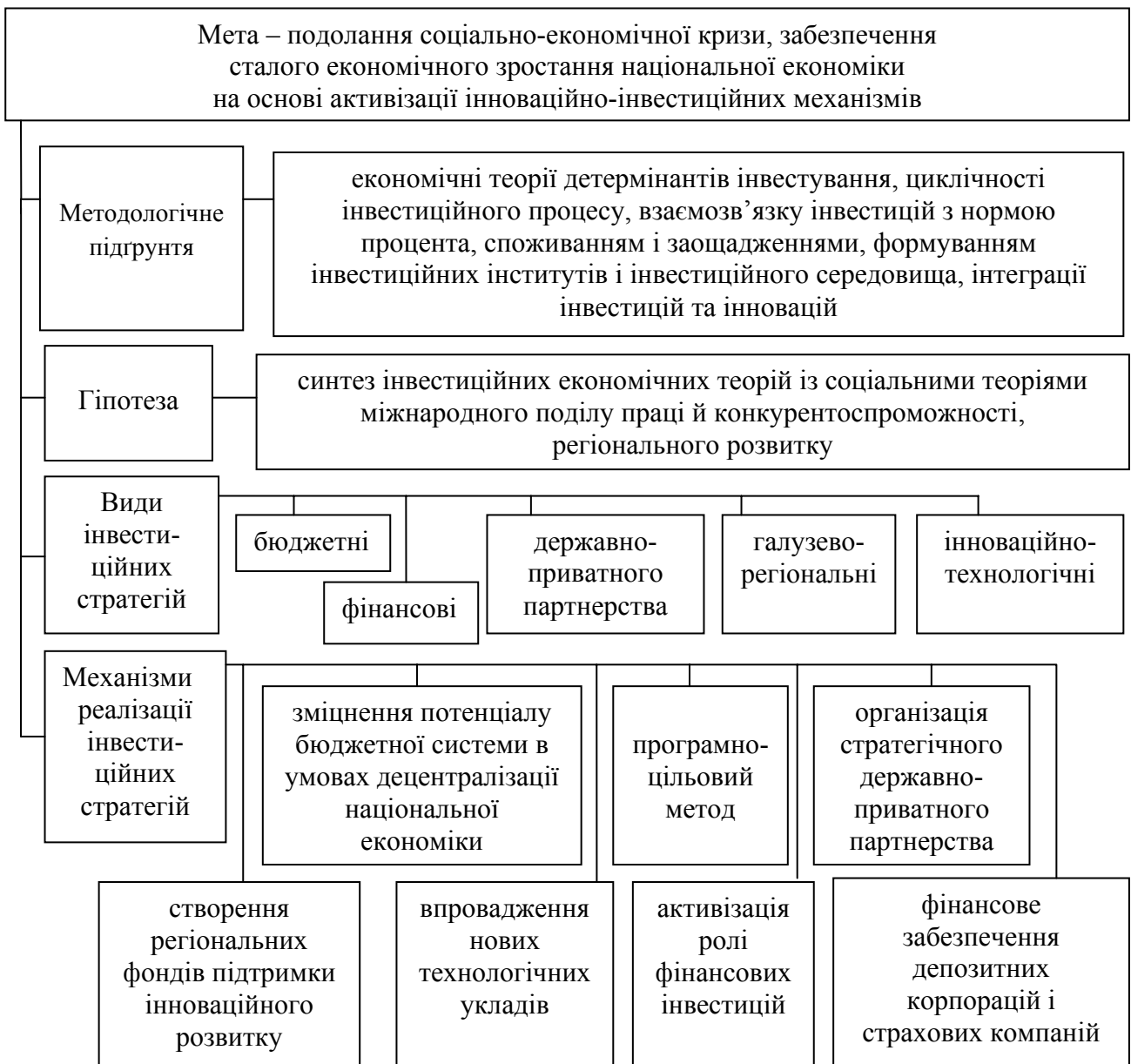
Рис. 3. Концептуальні засади вдосконалення механізмів стратегічного розвитку національної економіки в інвестиційній сфері

Інвестиційна стратегія є складовою загальної стратегії функціонування національної економіки, яка є сукупністю цілей інвестиційної діяльності та програмних заходів щодо їх досягнення, які структуровані в довгостроковій перспективі, фінансово обґрунтовані та забезпечені економічними ресурсами. В основі концептуальних засад удосконалення інвестиційних стратегій розвитку економіки України та механізмів їх реалізації лежить синтез програмних інвестиційних стратегій макро- і мезорівнів, корпорацій реального й фінансового секторів національної економіки (рис. 3).