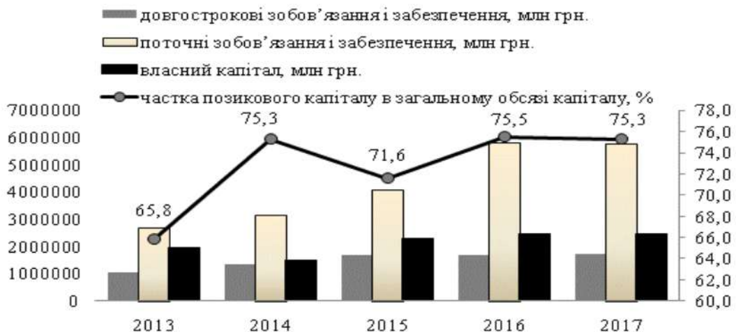
Рис. 1. Динаміка частки позикового капіталу підприємств України в загальному обсязі капіталу протягом 2013-2017 рр., млн. грн.

З метою наочності обсяги власного та частки позикового капіталу представлені на рис. 1.