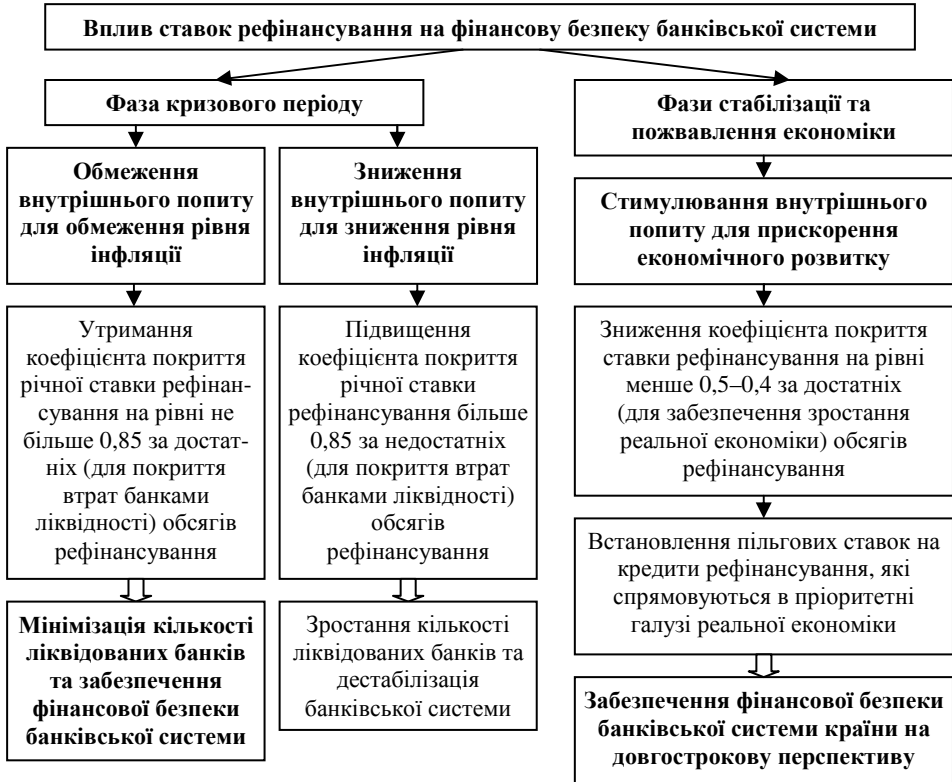
Рис. 4. Механізм впливу ставок рефінансування як монетарного інструменту на фінансову безпеку банківської системи, авторська розробка

обсягів операцій з рефінансування відповідно до циклічних фаз розвитку економіки за умов утримання співвідношення між обсягами операцій овернайт та іншими інструментами рефінансування на рівні не вище 0,5, що посилить спроможність банків протистояти кризам;