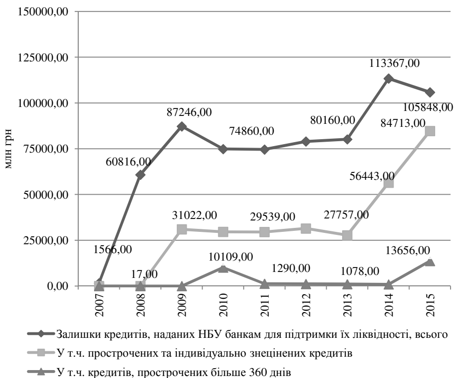
Рис. 3. Якісний склад кредитів рефінансування, наданих НБУ банкам України для підтримки їх ліквідності у 2007–2015 рр., розроблено за даними [18]

Варто також враховувати, що надання кредитів рефінансування неплатоспроможним чи істотно недокапіталізованим банкам до вирішення проблем їх капіталізації призвело до того, що станом на 01.04.2016 питома вага коштів рефінансування, отриманих неплатоспроможними банками від НБУ, досягла 25,06% та перевищила частку коштів, отриманих державними банками (24,13%, за даними фінансової звітності банків України [15]). Така ситуація обумовила суттєве погіршення якісної структури кредитів рефінансування, коли питома вага прострочених та індивідуально знецінених кредитів у структурі залишків кредитів, наданих НБУ банкам для підтримки їхньої ліквідності, зросла до 80,03% на кінець 2015 р. за відповідного зростання питомої ваги кредитів, прострочених понад 360 днів, у загальній їх структурі до 12,9% (рис. 3).