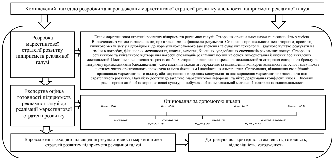
Рис. 4. Комплексний підхід до розробки та впровадження маркетингової стратегії розвитку діяльності підприємств рекламної галузі

З метою підвищення результативності маркетингової діяльності підприємств рекламної галузі на основі критеріїв визначеності, готовності, відповідності й узгодженості запропоновано науково-методичний підхід до розробки та впровадження маркетингової стратегії розвитку у діяльність підприємств рекламної галузі (рис. 4). Установлено, що такий науково-методичний підхід ґрунтується на розробці маркетингової стратегії розвитку підприємств рекламної галузі шляхом визначення її етапів і проведенні експертної оцінки готовності підприємств до реалізації заходів розвитку за допомогою шкали оцінювання.