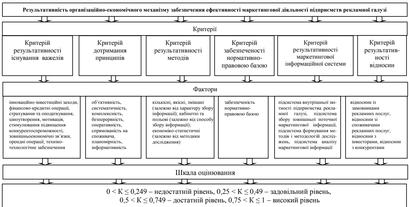
Рис. 2. Факторно-критеріальна модель оцінювання результативності організаційно-економічного механізму забезпечення ЕМД підприємств рекламної галузі

Проаналізовано результативність організаційно-економічного механізму забезпечення ЕМД підприємств рекламної галузі на основі запропонованої факторно-критеріальної моделі (рис. 2).