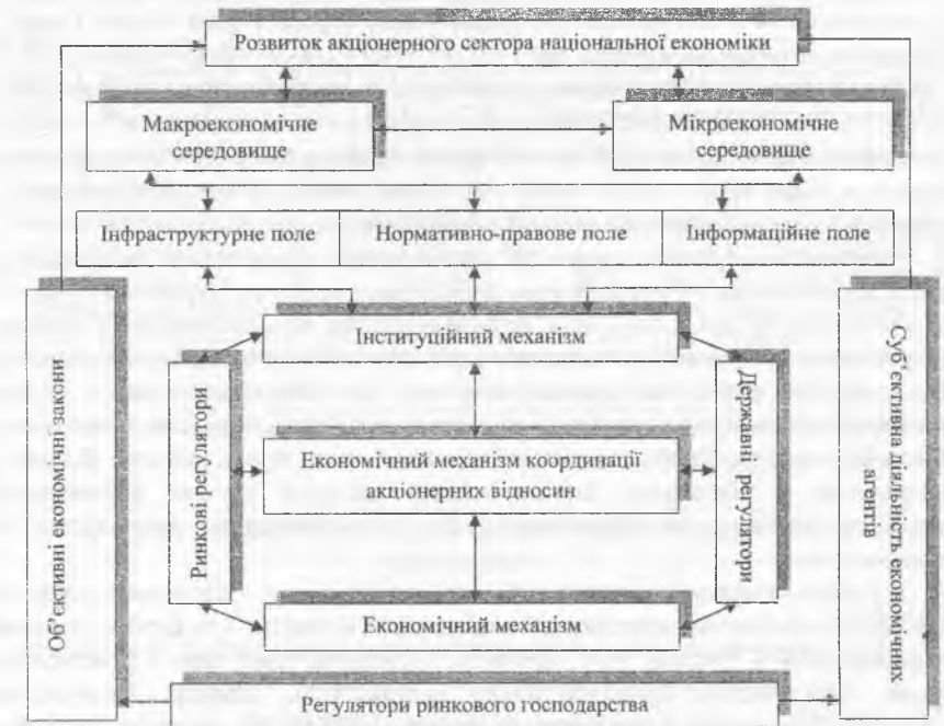
Рис. 1. Економічний механізм координації акціонерних відносин

відносин; досягаючи економічної безпеки акціонерного сектора; забезпечуючи ефективне функціонування акціонерного капіталу.