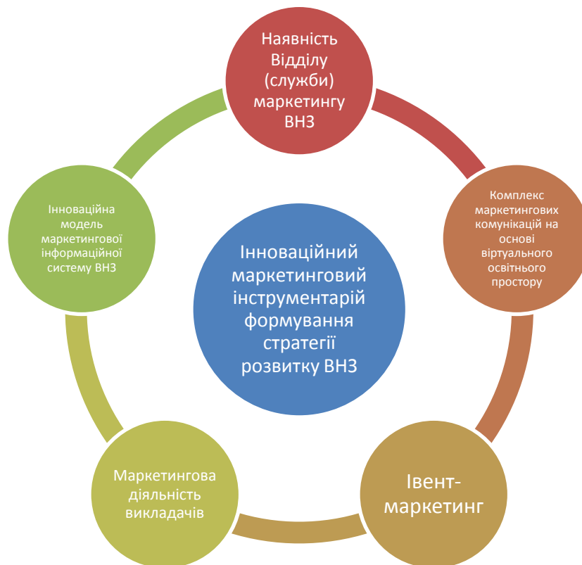
Рис. 1. Інноваційний маркетинговий інструментарій формування стратегії розвитку ВНЗ

Системне бачення інноваційних маркетингових інструментів формування стратегії розвитку ВНЗ представлено на рис. 1.