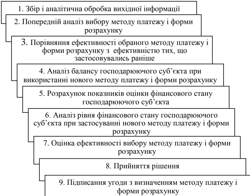
Рис.2. Технологічна карта оцінки ефективності вибору методу платежу і форми розрахунку за експортно-імпортними операціями

Розроблено технологічну карту оцінки ефективності вибору методу платежу і форми розрахунку для господарюючого суб'єкта, що здійснює експортно-імпорتنі операції (рис.2).