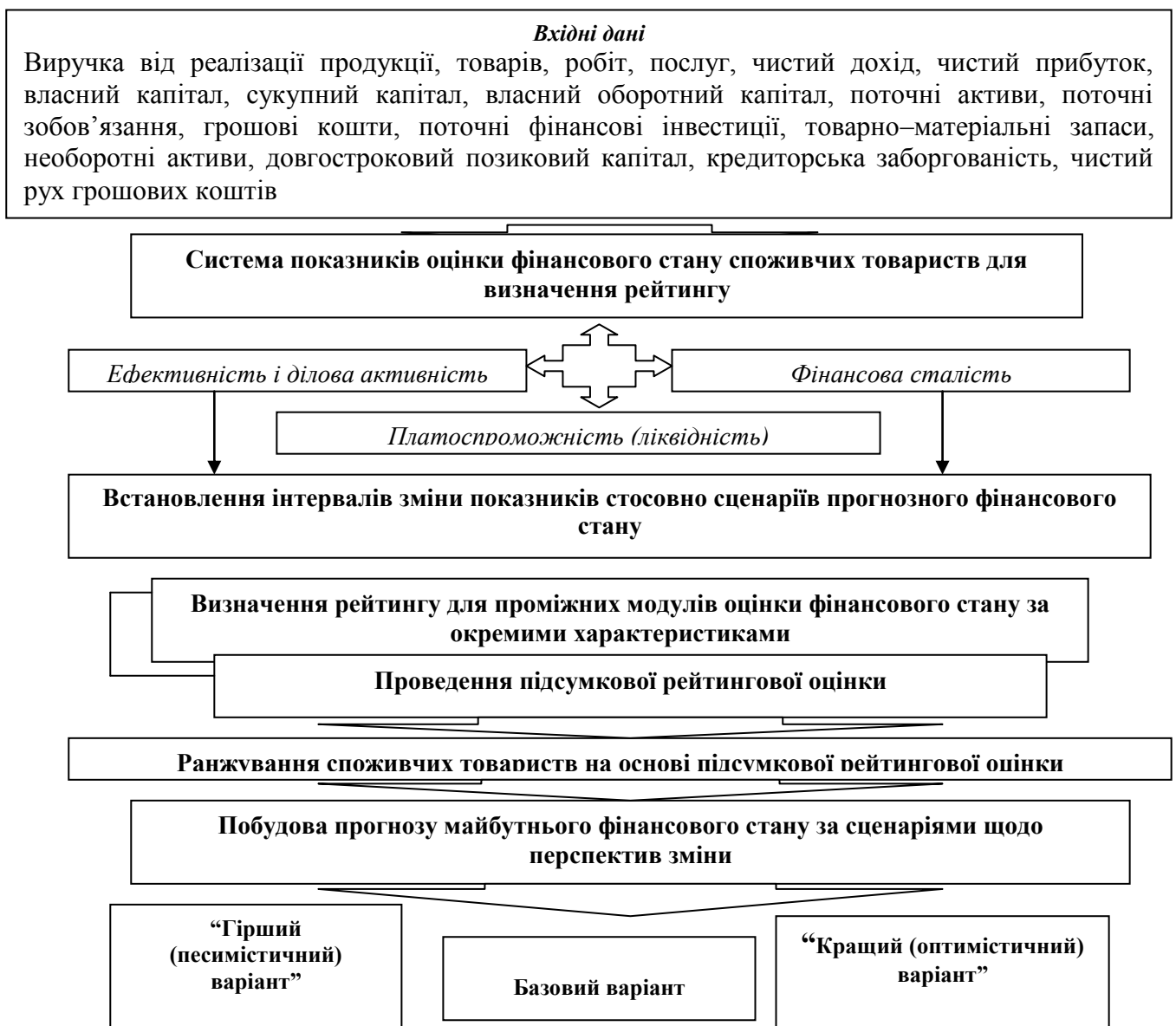
Рис. 2. Блок-схема застосування методики діагностики перспективного фінансового стану споживчого товариства (спілки) на основі ранжування рейтингу

Вперше запропоновано методику оцінки альтернативних варіантів прогнозу фінансового стану споживчого товариства (спілки) на основі ранжування господарюючих суб'єктів стосовно рейтингу їх фінансового стану. Розробку алгоритмів розрахункових процедур підпорядковано меті забезпечення обґрунтованої однозначної кількісної узагальнюючої оцінки фінансового стану будь-якого споживчого товариства (спілки) із досліджуваної сукупності – лідера чи аутсайдера для побудови прогнозу майбутнього фінансового стану. Для проведення перспективної діагностики фінансового стану значної кількості споживчих товариств або їх спілок структурована послідовність взаємопов'язаних аналітичних модулів, визначені їх обсяг і рівень деталізації, розроблений методичний інструментарій стосовно визначених етапів (рис. 2.).