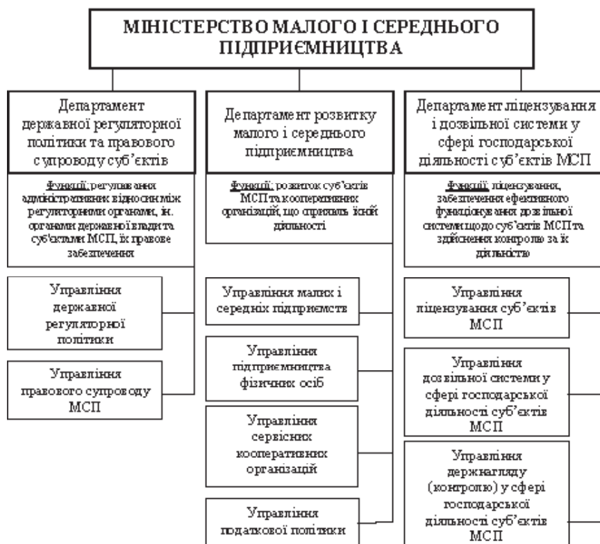
Рис. 3. Пропонована структура Міністерства малого і середнього підприємництва України

Підводячи підсумок вищесказаному, у загальних