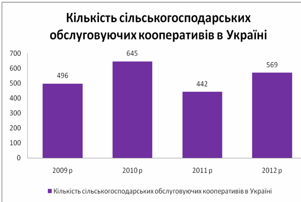
Рис. 1. Кількість СОК в Україні за 2009–2012 рр. [6, с. 6]

В 2013 р. – найбільша кількість СОК в Житомирській (105), Вінницькій (79) та АР Крим (84), найменша – в Тернопільській (10).