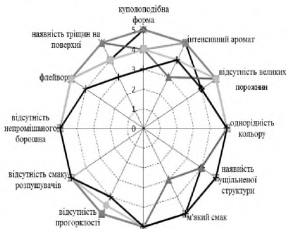
Рисунок 1 – Вплив борошна з нуту на сенсорні профілі кексів:

На підставі проведених технологічних відпрацювань було визначено органолептичні показники (рис. 1).