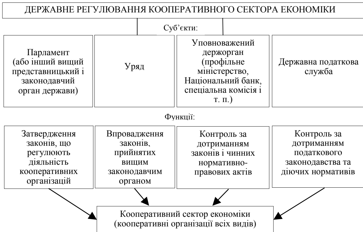
Рис. 1. Основні суб'єкти регуляторного впливу на кооперативний сектор економіки та їх головні функції у процесі його регулювання

По-друге, встановлено наявність різних підходів до визначення державою регуляторів кооперативного сектора економіки, на вибір якого впливають такі чинники, як наявний економічний рівень розвитку окремо взятої країни, масштабність кооперативного сектора, діючі кооперативні традиції, а також умови, поставлені зарубіжними донорами щодо реалізації проектів технічної допомоги національному кооперативному руху. Виявлено, що в окремих випадках у ролі регулятора можуть виступати Центральні банки (стосовно кредитно-кооперативних організацій), а також профільні міністерства, незалежні державні установи, загальнонаціональні об'єднання кооперативів (стосується усіх видів кооперації).