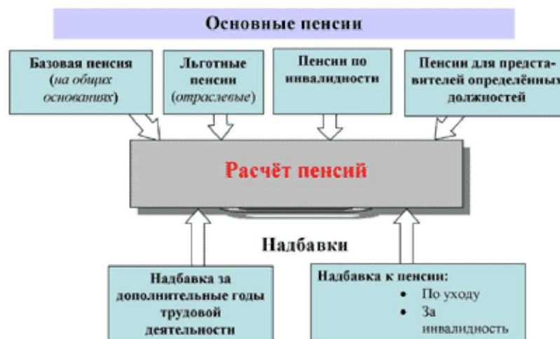
Рисунок 4. Расчёт пенсий Азербайджанской Республики[16]

Согласно закону о пенсионном обеспечении, реальный размер получаемой пенсии может быть увеличен за счёт дополнительных лет трудовой деятельности пенсионера (выше установленной законодательством нормы), из-за необходимости ухода за престарелым пенсионером, наличии в семье неработающего пенсионера членов семьи с ограниченными возможностями к трудовой деятельности, за заслуги перед отечеством и т.д. (рисунок 4).