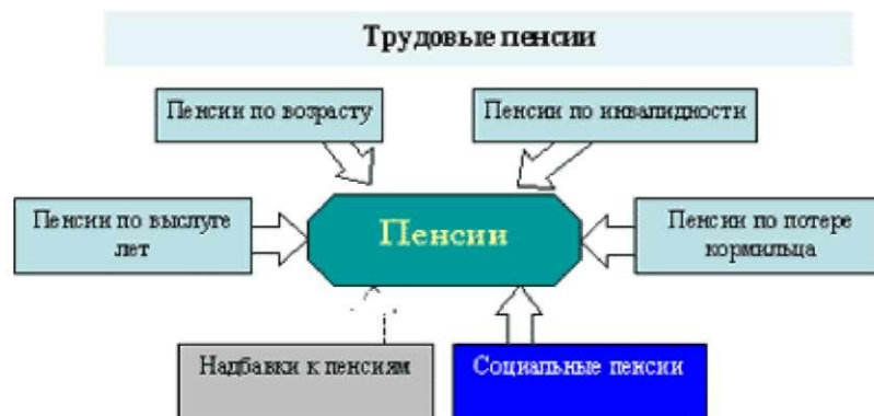
Рисунок 3. Виды пенсий Азербайджанской Республики[16]

Согласно закону о пенсионном обеспечении, реальный размер получаемой пенсии может быть увеличен за счёт дополнительных лет трудовой деятельности пенсионера (выше установленной законодательством нормы), из-за необходимости ухода за престарелым пенсионером, наличии в семье неработающего пенсионера членов семьи с ограниченными возможностями к трудовой деятельности, за заслуги перед отечеством и т.д. (рисунок 4).