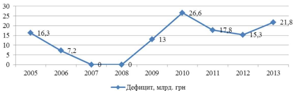
Рисунок 1. Дефицит Пенсионного фонда Украины за 2005-2013 гг, млрд. грн.

женщин до «мужских» 60-ти, ограничение максимального размера пенсионных выплат (если во времена СССР самая большая пенсия превышала минимальную примерно в 8 раз, то в независимой Украине - 60–80 р.) не принесло ожидаемых результатов (рис. 1). Дефицит продолжает расти. Кроме того, с каждым годом растёт долг Пенсионного фонда перед Государственным бюджетом. Если в 2003 году за счет государственного бюджета формировалось 7,31% доходов Пенсионного фонда, то в 2013 – 22,8%. Соответственно сокращается удельный вес собственных доходов Пенсионного фонда (рис. 2).