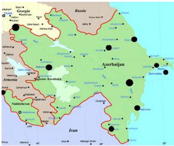
Рис. 1. Сеть RNM ASP станций.