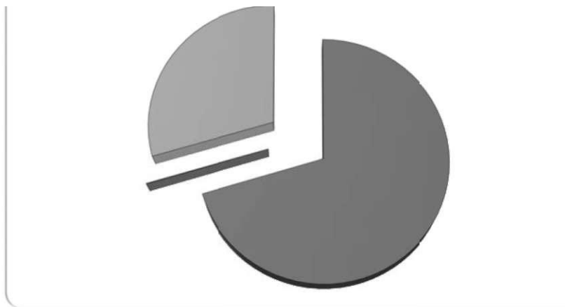
Рис. 1. Структура доходів Пенсійного фонду України у 2011 році

державного бюджету є значною - 29,9 %, тоді як кошти фондів соціального страхування становлять лише 0,1% (див. рис.1).