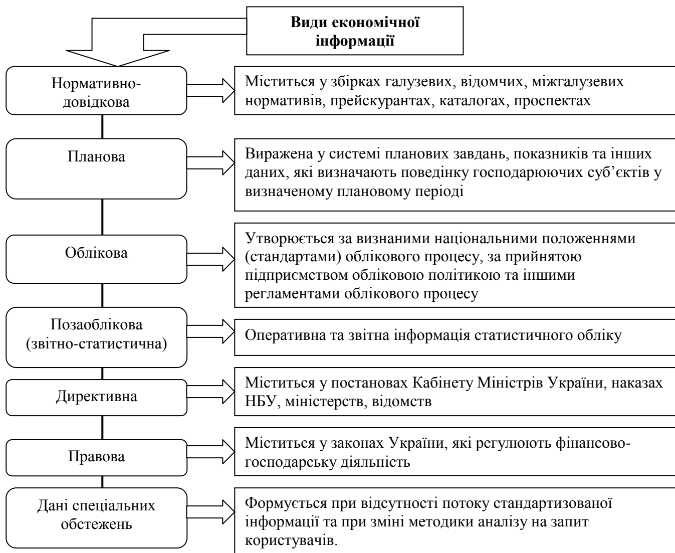
Рис. 1. Класифікація економічної інформації

Інформація є невичерпним ресурсом, використання якого однією людиною не виключає можливостей його використання іншими людьми. Конкретна інформація може бути використана різними суб'єктами в різних місцях. Враховуючи те, що конкретні види інформації можуть мати надзвичайне значення для забезпечення конкурентоспроможності підприємства, галузі, економіки країни, то ці види інформації захищаються правами інтелектуальної власності. Ці права обмежують доступ до певної інформації та регулюють відносини щодо використання доходу, отриманого від її споживання [1., с. 32]. Для проведення аналізу фінансових результатів використовують різні види економічної інформації (див. рис. 1).