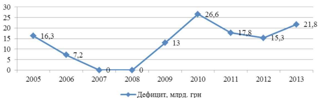
Рисунок 1. Дефицит Пенсионного фонда Украины за 2005-2013 гг, млрд. грн.

заны условия Внедрения Накопительной пенсионной системы: сбалансированность бюджета Пенсионного фонда в соответствии с международными стандартами бухгалтерского учета; создание институциональных компонентов функционирования накопительной системы пенсионного страхования; принятие законодательных актов, необходимых для функционирования накопительной системы пенсионного страхования и т.д. [1]. В условиях 22-х миллионного дефицита Пенсионного фонда при данном механизме формирования доходов внедрение накопительного уровня пенсионной системы представляется невозможным. Повышение в 2011 году пенсионного возраста для женщин до «мужских» 60-ти, ограничение максимального размера пенсионных выплат (если во времена СССР самая большая пенсия превышала минимальную примерно в 8 раз, то в независимой Украине - 60-80 р.) не принесло ожидаемых результатов (рис. 1). Дефицит продолжает расти. Кроме того, с каждым годом растет долг Пенсионного фонда перед Государственным бюджетом. Если в 2003 году за счет государственного бюджета формировалось 7,31% доходов Пенсионного фонда, то в 2013 - 22,8%. Соответственно сокращается удельный вес собственных доходов Пенсионного фонда (рис. 2).