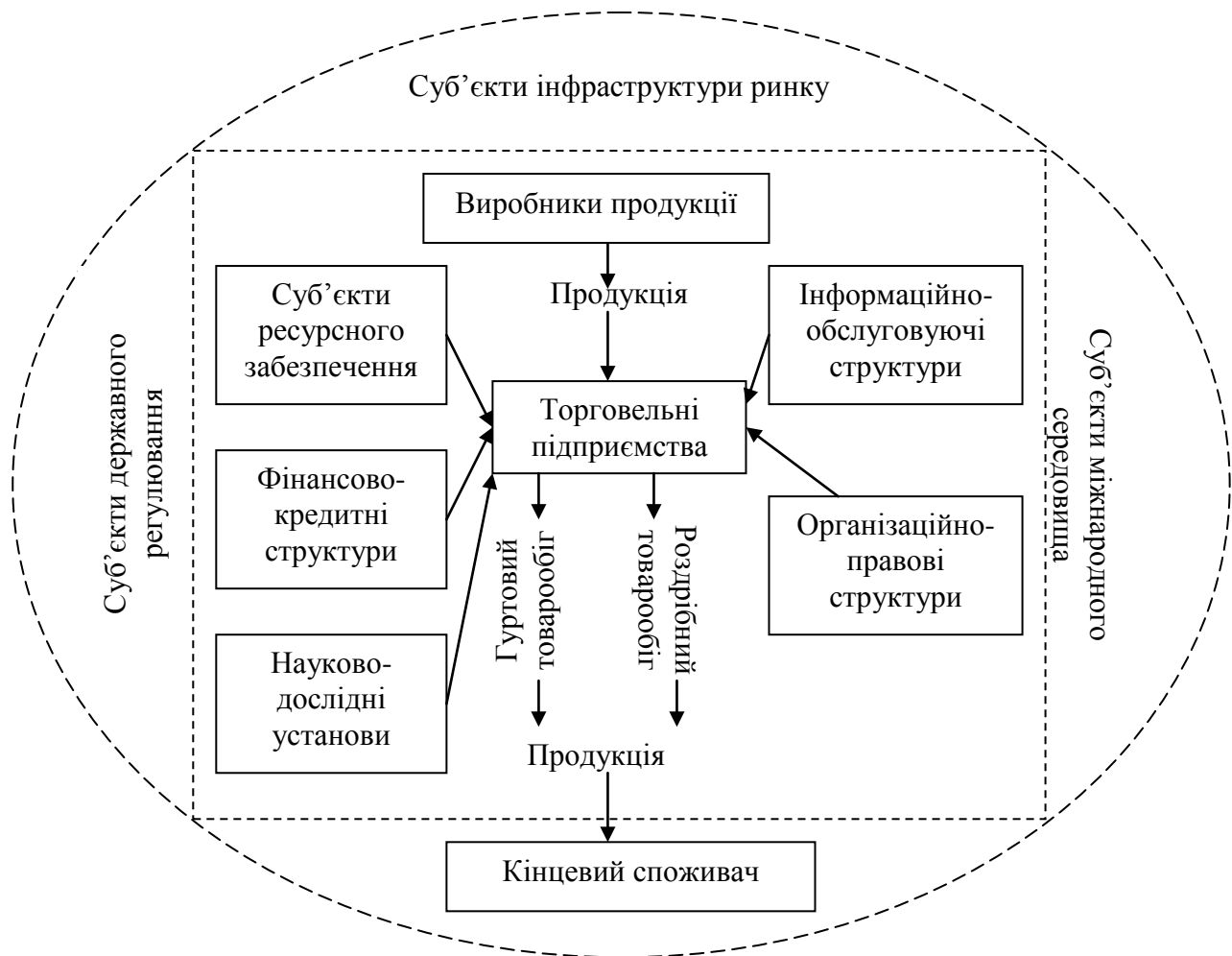
Рис. 2. Модель інфраструктури ринку забезпечення ефективного функціонування та розвитку торговельних підприємств [розробка автора]

платоспроможного попиту та потреб споживачів визначається кількість суб'єктів інфраструктури (торговельних підприємств) на споживчому ринку. Для забезпечення ефективного функціонування та розвитку торговельних підприємств нами запропоновано модель інфраструктури ринку (рис. 2).