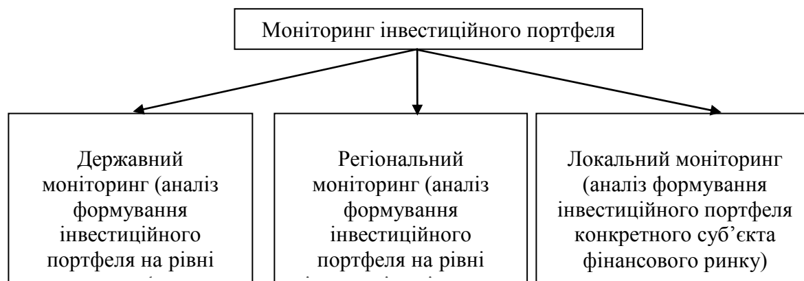
Рисунок 2 – Класифікація моніторингу за об'єктами аналізу (авторська розробка)

Класифікація моніторингу за об'єктами аналізу представлена на рис. 2.