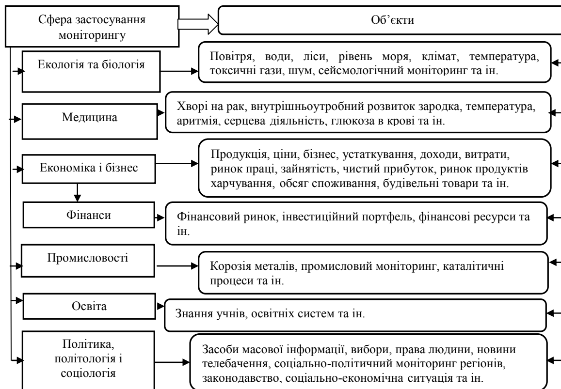
Рисунок 1 - Сфери та об'єкти застосування моніторингу

Протягом останніх десятиліть межі застосування цього поняття надзвичайно розширилися. В сучасних умовах він використовується у різних сферах практичної діяльності: екології, біології, соціології, педагогіці, економіці, психології та, поза всяким сумнівом, управлінні, адже основною сферою прикладного застосування моніторингу є інформаційне обслуговування управління різноманітних галузей та видів діяльності (рис. 1).