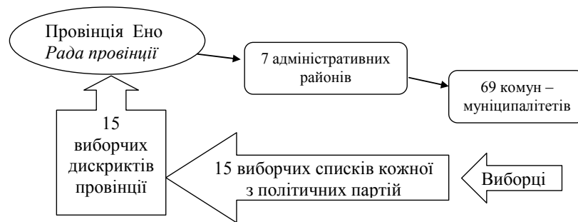
Рис. 2. Адміністративно-територіальний устрій провінції Ено і вибори до її Ради провінції

У франкомовному регіоні Валлонії всього п'ять провінцій (Брабан Валлон, Ено, Л'єж, Люксембург, Намюр) і виборці кожної мають призначити своїх представників в Раду провінції (рис. 2). Провінції розподілені на кілька виборчих округів – дистрикти. У провінції Ено – 15 виборчих дистриктів, які об'єднують 69 комун із семи адміністративних районів. У кожному дистрикті провінції політична партія представляє свій виборчий список. Єдиний список партії у виборах до ради провінції складається з 15 списків кожного дистрикту (виборчого округу).