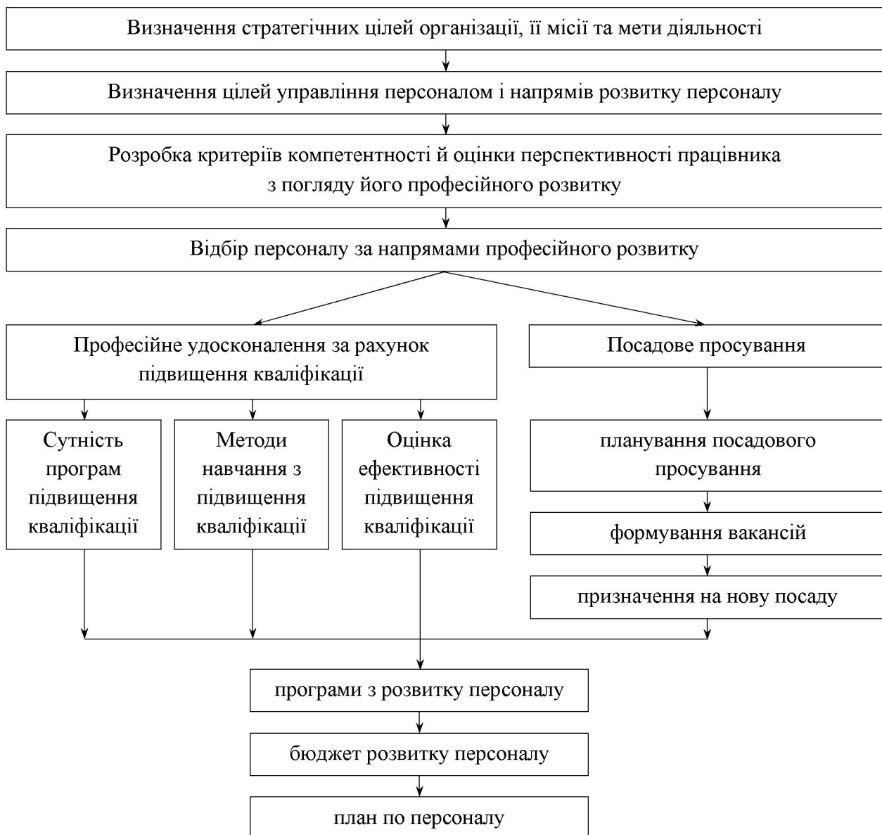
Рис. 2. Управління підвищенням кваліфікації як складової формування середнього класу України

Враховуючи вищезазначене, зауважимо, що підвищення кваліфікації є важливою складовою професійного розвитку персоналу. На рис. 2 представлений механізм управління процесом професійного розвитку персоналу.