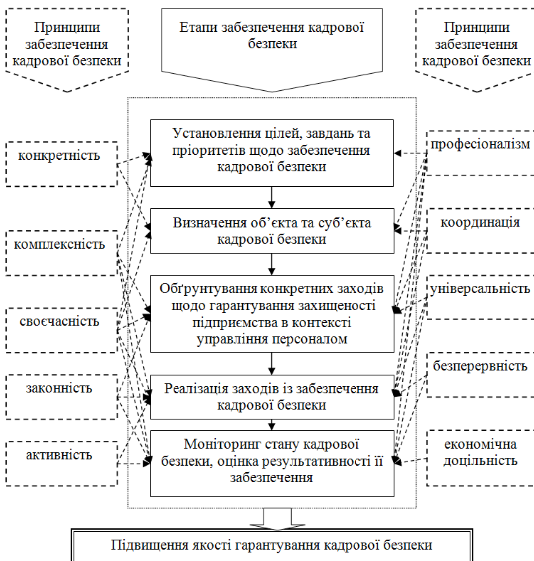
Рис. 2. Відповідність принципів та етапів забезпечення кадрової безпеки на підприємстві

Якщо уявити процес забезпечення кадрової безпеки на підприємстві у вигляді послідовних організаційних стадій його здійснення, то в узагальненому вигляді він складатиметься з таких етапів: установлення цілей, завдань і пріоритетів щодо забезпечення кадрової безпеки; визначення об'єкта та суб'єкта кадрової безпеки; обґрунтування конкретних заходів щодо гарантування захищеності підприємства в контексті управління персоналом; безпосереднє забезпечення кадрової безпеки (реалізація зазначених заходів), моніторинг стану кадрової безпеки та оцінка результативності її забезпечення. Ефективність здійснення кожного із зазначених етапів значним чином визначається ступенем дотримання відповідних кожному етапу принципів забезпечення кадрової безпеки (рис. 2).