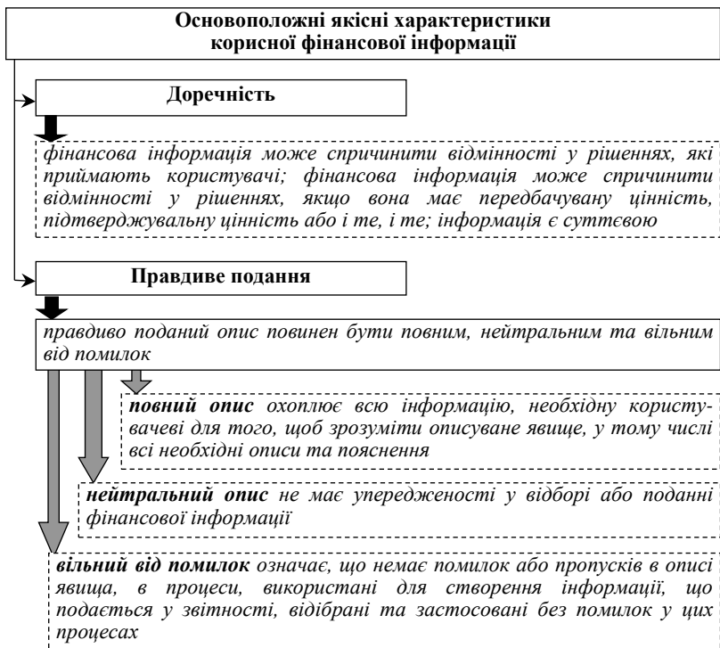
Рисунок 1 – Основоположні якісні характеристики корисної фінансової інформації

Основоположними якісними характеристиками корисної фінансової інформації є доречність та правдиве подання (рис. 1).