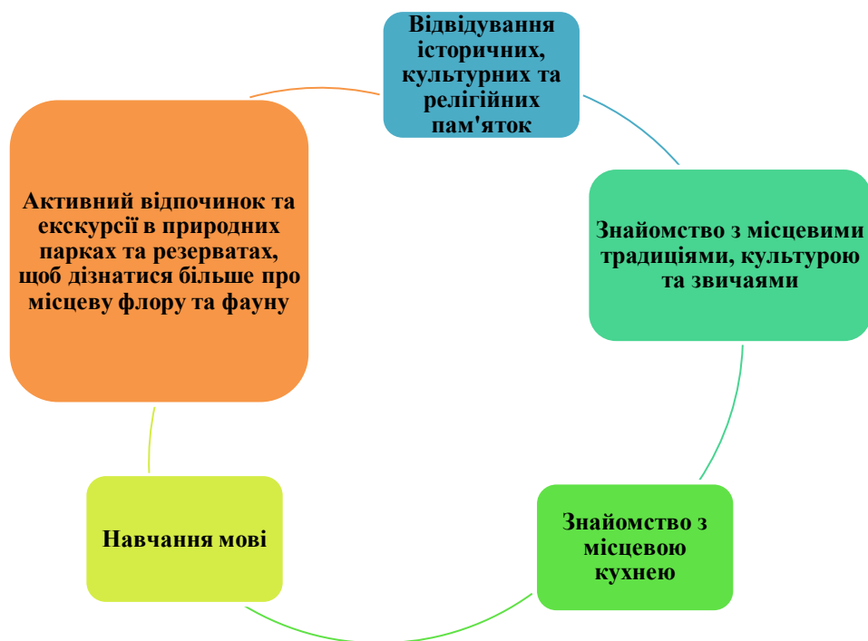
Рис.1.1. Характеристики культурно-пізнавального туризму

Специфіка сфери культури полягає в тому, що вона слідокрайду об'єктивних факторів в приватний сектор в ній в умовах ринкової економіки займає незначне місце, оскільки сфера дії ринкового механізму і принцип платності лімітована [18, с.100]. Послуги сфери культури представляють собою змішані блага, що володіють подвійною природою, спрямовані на задоволення різноманітних духовних і естетичних потреб населення. Поряд з властивостями подільності, конкурентності, унікальності вони мають значний зовнішній ефект, що проявляється через пізнання життєвого шляху всього людства, вибір між моральними і аморальними категоріями, гармонією і дисгармонією.