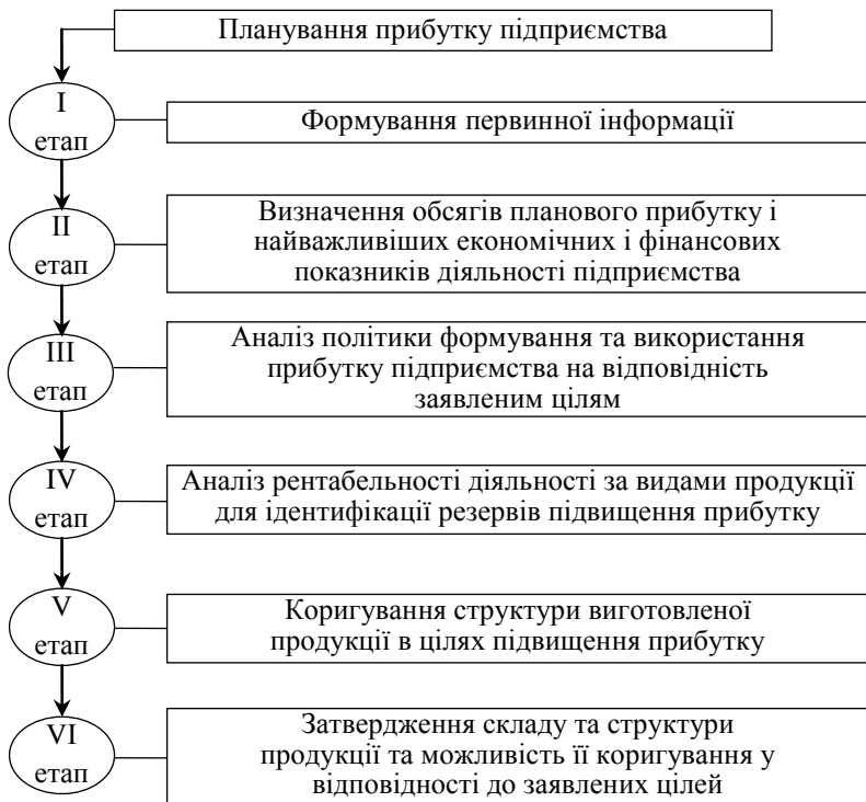
Рисунок 1 – Узагальнений процес планування прибутку підприємства [1]

Весь процес планування прибутку на підприємстві включає в себе шість етапів (рис. 1): зовнішніх можливостей і обмежень підприємства, внутрішніх можливостей і обмежень підприємства, схильності до ризику.