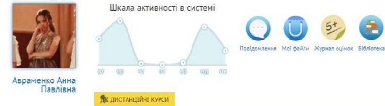
Рисунок 1.1 – Знімок з екрана сторінки досягнень освітньої активності здобувача вищої освіти в MOODLE у межах освітньої діяльності [3]

Також за допомогою системи MOODLE здобувачі вищої освіти можуть відслідкувати відсоток виконаного ними окремого навчального курсу і переглянути звіт за курсом загалом, в якому вказано: оцінка за виконані тести і завдання, відсоток за пройденим тестом і внесок у підсумок курсу (рис. 1.2–1.3).