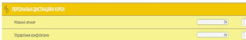
Рисунок 1.5 – Знімок з екрану сторінки досягнень освітньої активності студентів в MOODLE в межах вибіркових навчальних дисциплін [3]

Завдяки нововведенням ПУЕТ у 2020 році здобувачі вищої освіти можуть проходити обрані ними раніше персональні дистанційні курси (вибіркові навчальні дисципліни), що виходять за рамки їхньої професійної програми (рис. 1.5).