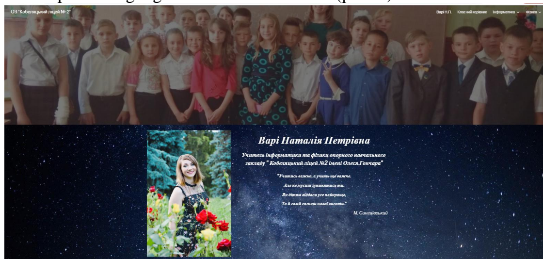
Рисунок 4 – Персональний сайт Н. Варі

Розглянемо мій особистий сайт для роботи з учнями під час дистанційного навчання https://sites.google.com/view/var-2020/ (рис. 4).