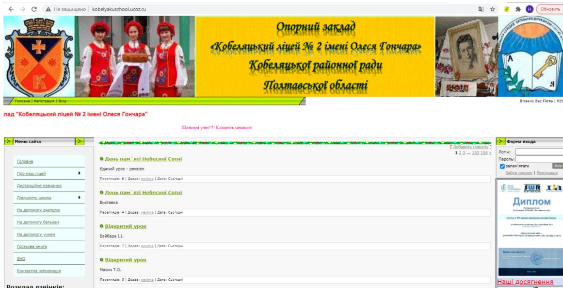
Рисунок 1 – Сайт опорного закладу «Кобеляцький ліцей № 2 імені Олесея Гончара»

Сайт нашого закладу був створений у 2008 році http://kobelyakuschool.ucoz.ru/ (рис. 1).